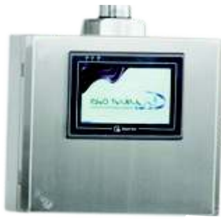
Pannello operatore touch screen